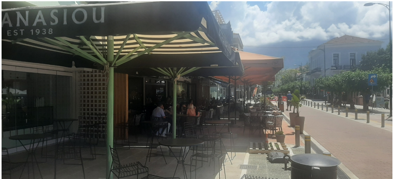
ΟΔΟΣ ΝΑΥΑΡΙΝΟΥ (Ο.Τ 6)