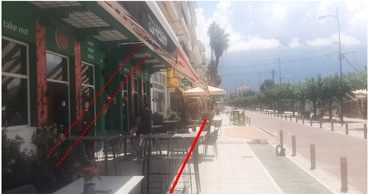
Ο.Τ 4 - ΕΝΔΕΙΞΗ ΖΩΝΗΣ ΤΡΑΠΕΖΟΚΑΘΙΣΜΑΤΩΝ & ΕΜΠΟΡΕΥΜΑΤΩΝ