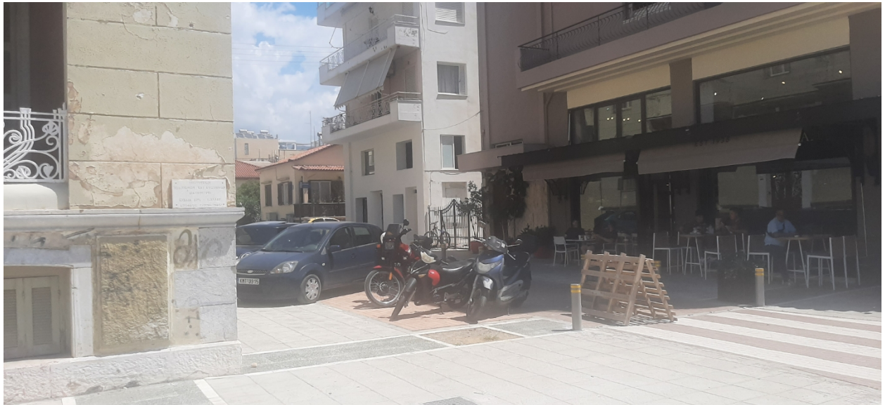
ΟΔΟΣ ΝΑΥΑΡΙΝΟΥ & ΒΥΡΩΝΟΣ (Ο.Τ 5&6)