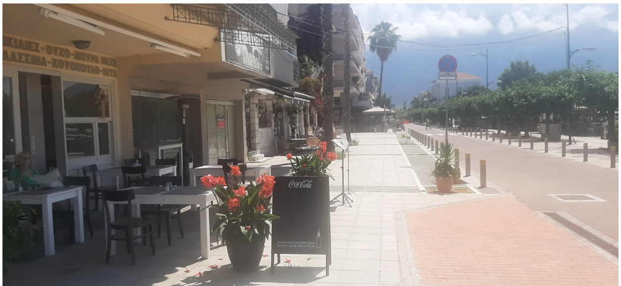
ΟΔΟΣ ΝΑΥΑΡΙΝΟΥ (Ο.Τ 5)