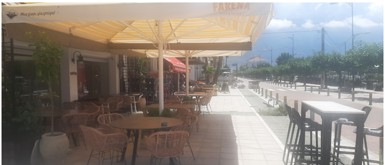
ΟΔΟΣ ΝΑΥΑΡΙΝΟΥ (Ο.Τ 4)