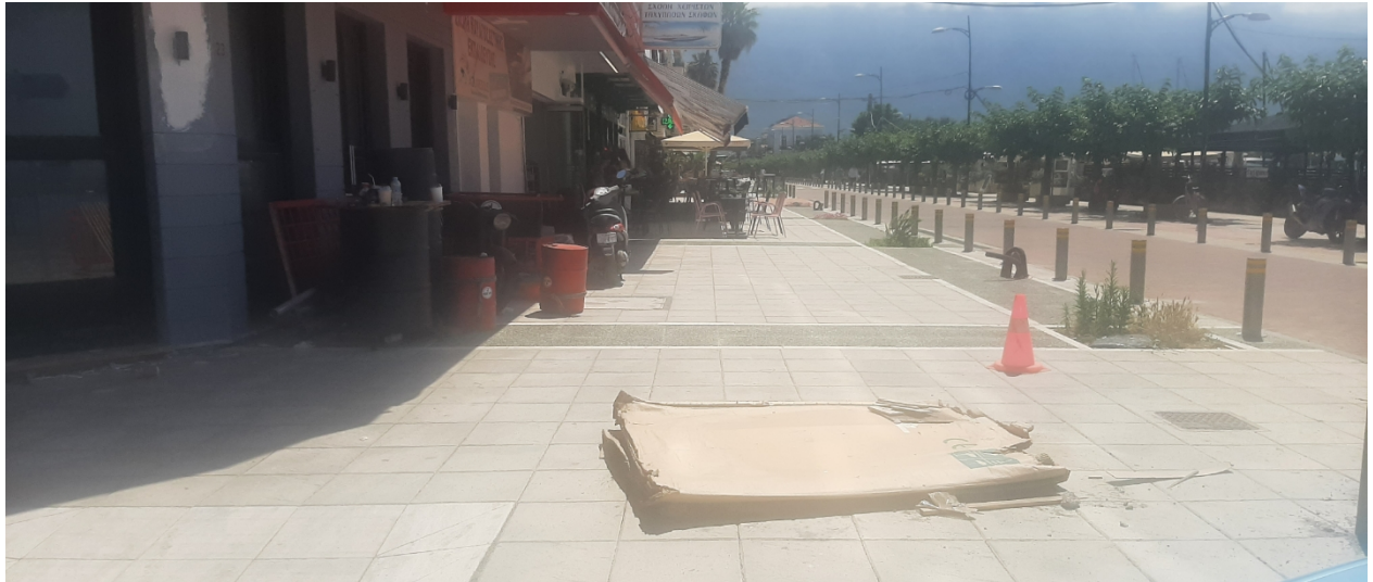
ΟΔΟΣ ΝΑΥΑΡΙΝΟΥ & ΦΑΡΩΝ (Ο.Τ 4)