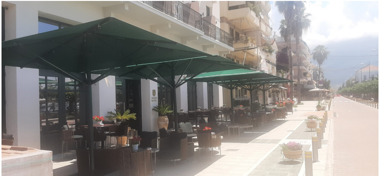
ΟΔΟΣ ΝΑΥΑΡΙΝΟΥ (Ο.Τ 5)