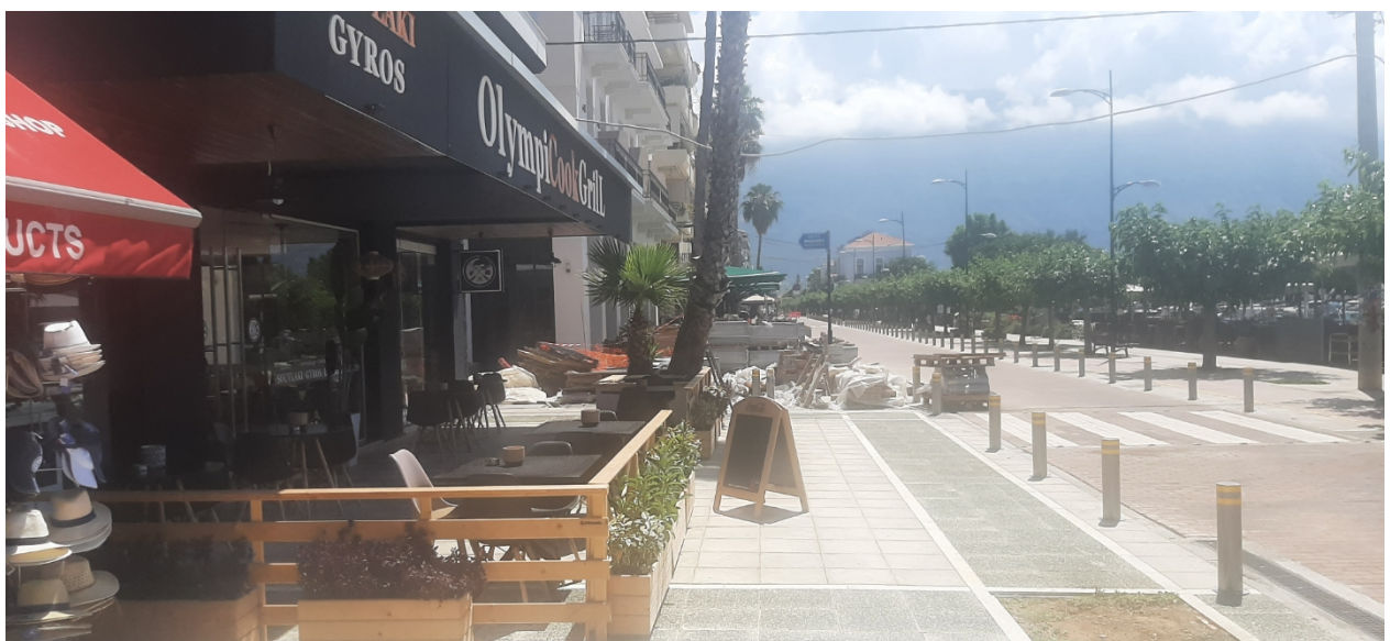
ΟΔΟΣ ΝΑΥΑΡΙΝΟΥ & ΜΑΙΖΩΝΟΣ (Ο.Τ 4)