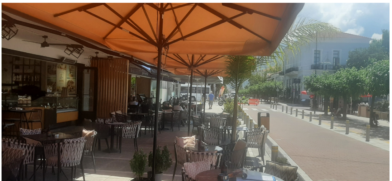
ΟΔΟΣ ΝΑΥΑΡΙΝΟΥ (Ο.Τ 6)