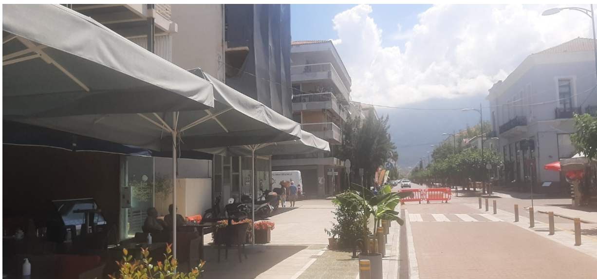
ΟΔΟΣ ΝΑΥΑΡΙΝΟΥ (Ο.Τ 6)

Σημείο κατασκευής των εσοχών τροφοδοσίας όπου περιορίζεται η Ζώνη κίνησης των πεζών (ελάχιστο πλάτος 1.80 μ.)