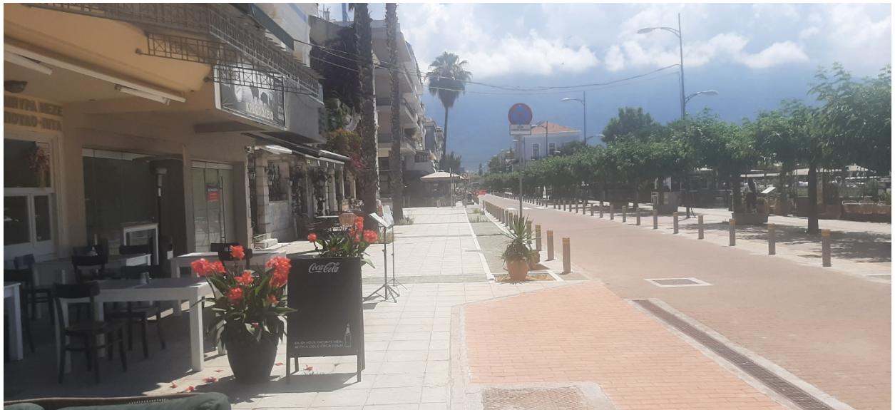
ΟΔΟΣ ΝΑΥΑΡΙΝΟΥ (Ο.Τ 5)