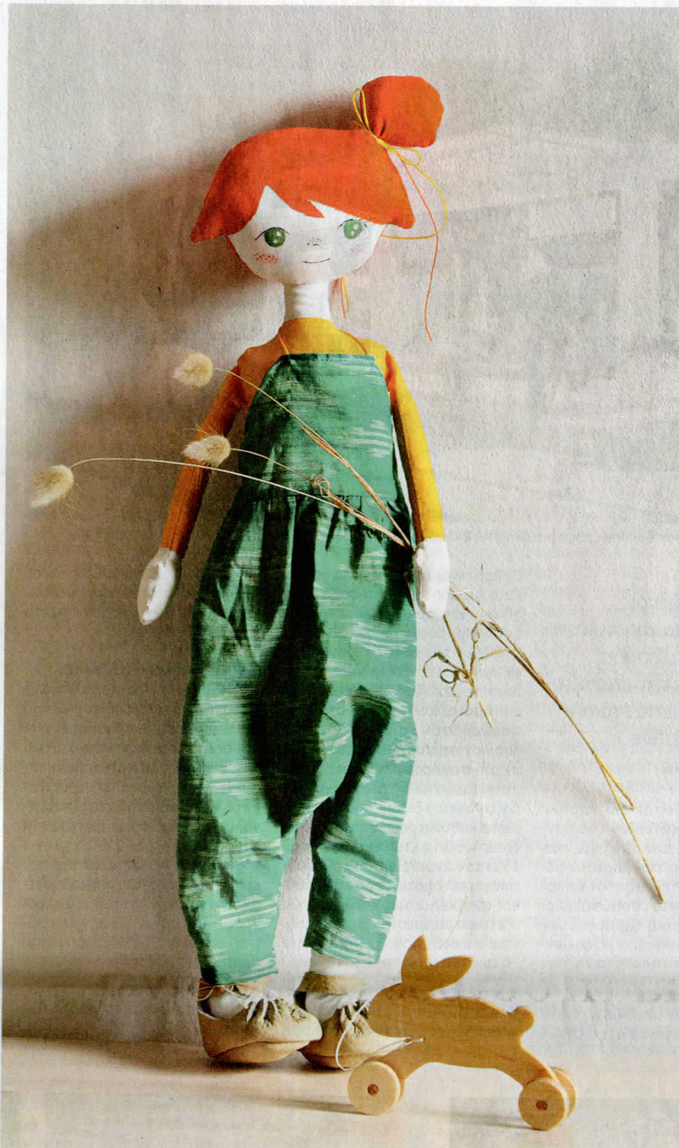
Η αναγνώριση για τα παιχνίδια «Hersin means made by hand» ήρθε από τη βρετανική Vogue.

χνίδια που θα φτιάξουμε – πρέπει να είναι επιλογή του παιδιού το τι θα πάρει στα χέρια του. Δυστυχώς, στα παιχνίδια απουσιάζει η ανοικτή αντίληψη, αν και είναι απαραίτητη στην διαμόρφωση των προσωπικότητων», κόντρα στην πολυπλοκότητα των παιχνιδιών, τα οποία κυκλοφορούν ευρέως σήμερα στην αγορά – φορτωμένα αξεσουάρ, μεταλλασσόμενα σε κάτι διαφορετικό. «Αυτά τα περίπλοκα παιχνίδια συχνά λειτουργούν περιοριστικά για τα παιδιά, επειδή τους δίνουν συγκεκριμένες επιλογές, που τις έχουν αποφασίσει άλλοι. Αντίθετα, με μία απλή κούκλα τα παιδιά αφήνουν τη φαντασία τους ελεύθερη. Το παιχνίδι εξελίσσεται πιο προσωπικά και πιο δημιουργικά. Εντέλει, με κάτι πολύ απλό, μπορούν να παίξουν και να χαρούν πραγματικά».