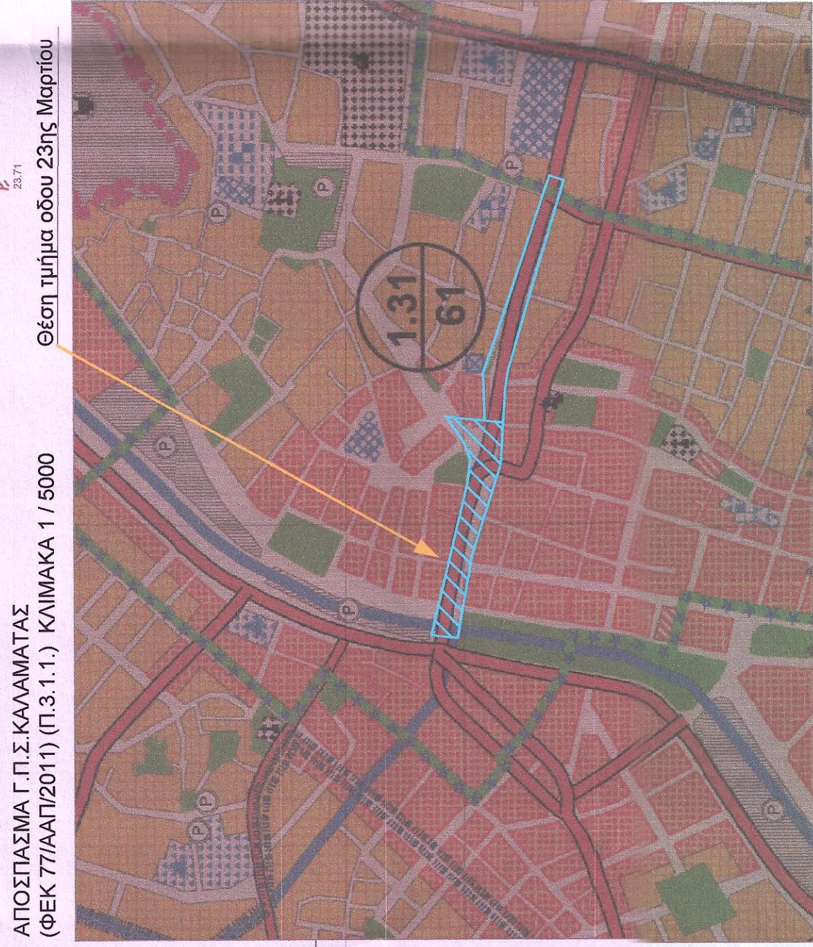
ΑΠΟΣΠΑΣΜΑ Γ.Π.Σ. ΚΑΛΑΜΑΤΑΣ (ΦΕΚ 77/Α/17/2011) (Π.3.1.1.) ΚΛΙΜΑΚΑ 1 / 5000