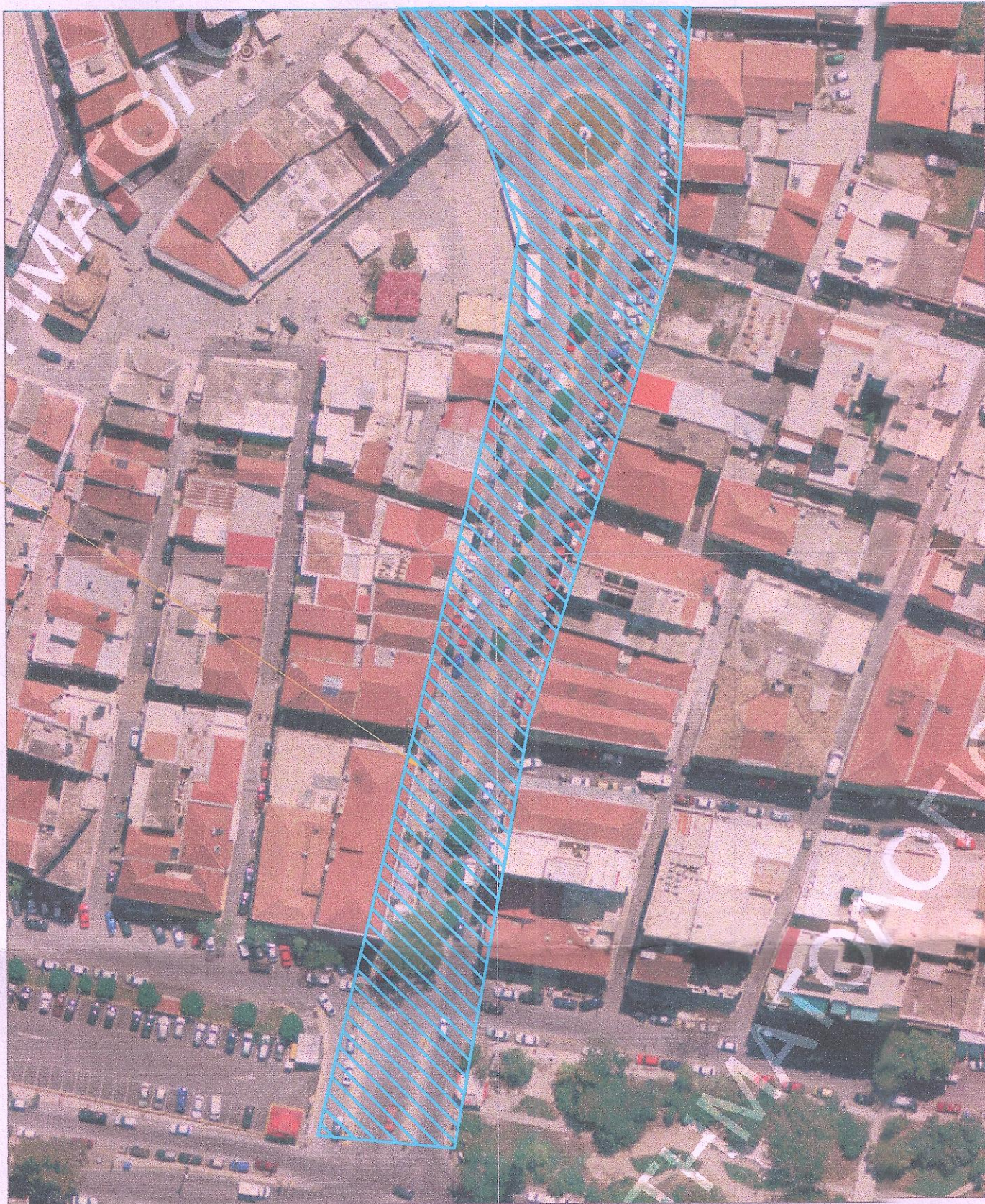
ΑΠΟΣΠΑΣΜΑ Ρ.Σ. ΚΑΛΑΜΑΤΑΣ -ΦΕΚ 634/89 (Π.Ν.15_03) ΚΛΙΜΑΚΑ 1 / 1000